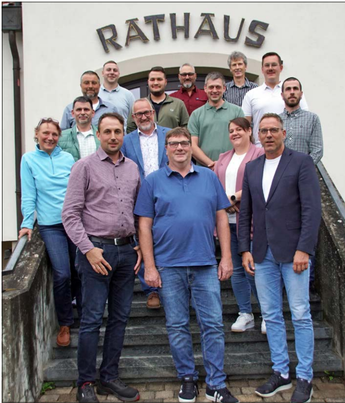
Bild zeigt den neuen Gemeinderat.