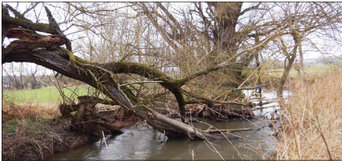
Rauhe Ebrach mit hohem Totholzanteil

Als Lebensader für Menschen, Tieren und Pflanzen fließt die Rauhe Ebrach von ihrer Quelle im Wust- vielerforst im Steigerwald durch das Fränkische Keuper-Lias-Land auf einer Länge von ca. 50 km bis zur Mündung bei Pettstadt in die Regnitz. Der rd. 30 km lange Gewässerabschnitt ab der Einmündung des Heinzleimbaches bei Prölsdorf bis zur Mündung der Rauhen Ebrach in die Regnitz ist dem Flusswasserkörper „Rauhe Ebrach von Prölsdorf bis Mündung in die Regnitz“ (2_F080) zugeordnet.