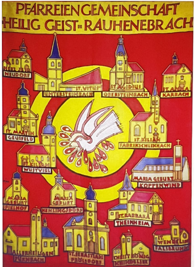
Fahne der Pfarreiengemeinschaft