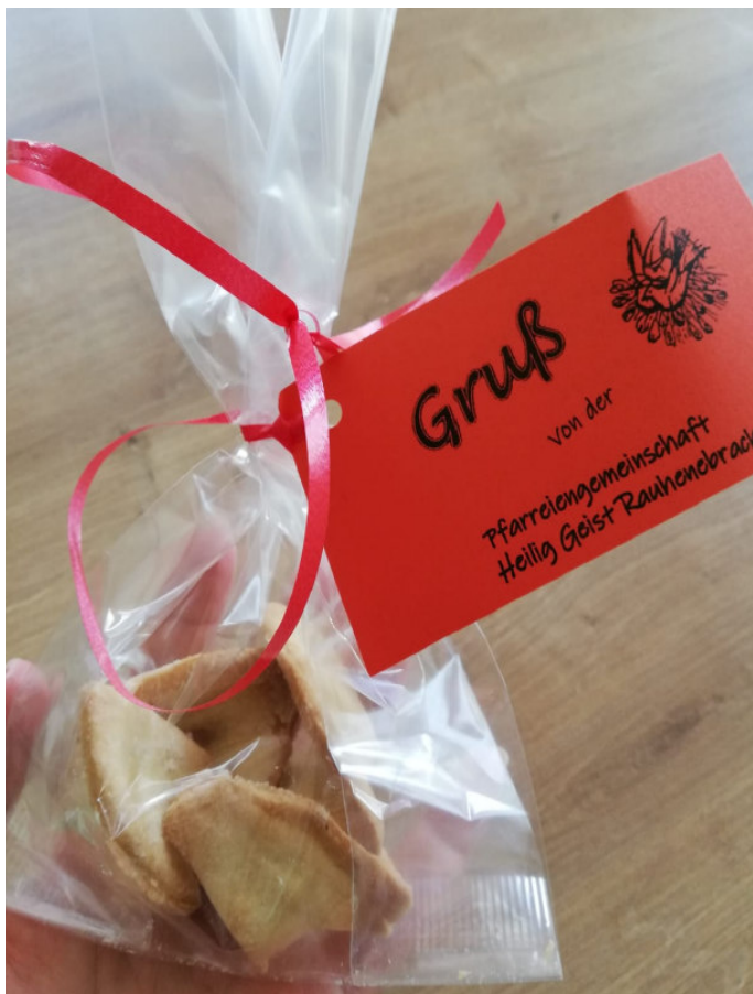
Päckchen mit Glückskekzen

Dorfbewohner, deren Nöte und seelsorglichen Bedarfe (z. B. Besuche, Kasualien wie Geburt, Trauer, Geburtstag, Neuzugezogene ...) richtet. Je nach Absprache und „Mut“ des jeweiligen pastoralen Auges gestaltet der- oder diejenige ihren bzw. seinen Dienst selbst. Dieser wird mit dem Pfarrer abgesprochen und schriftlich festgehalten. So freuen wir uns auf viele weitere Impulse und Ideen durch die Zusammenarbeit in Pfarreiengemeinschaft und Raum!