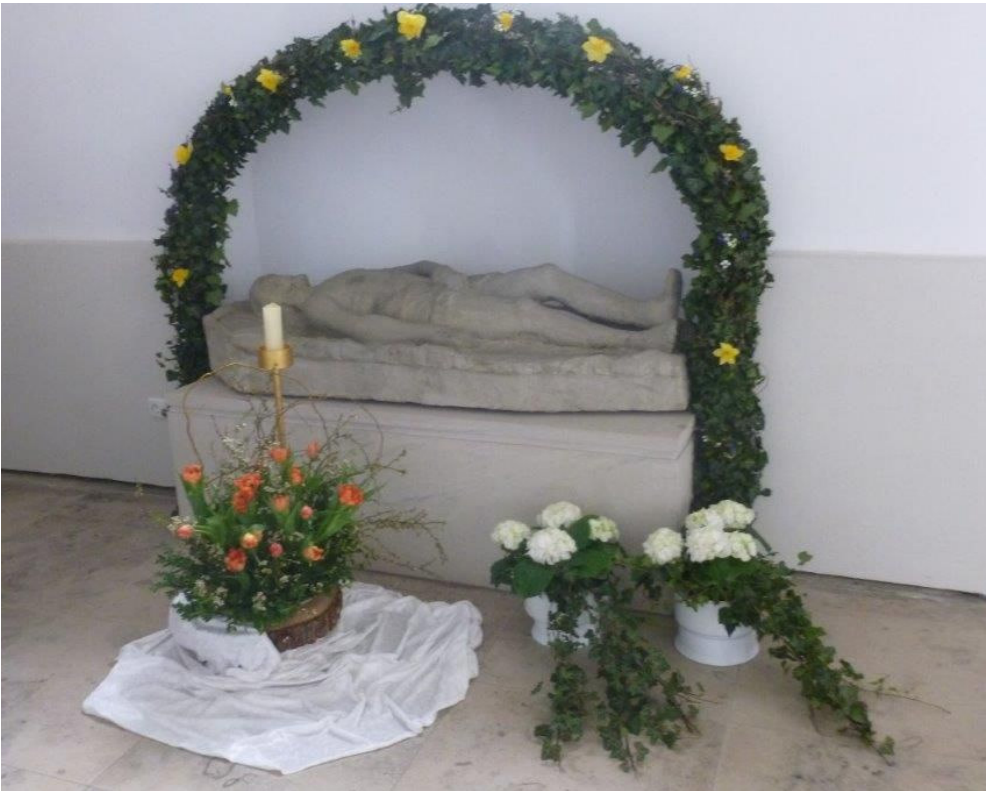
Bild: Wustviel Kirche St. Kilian - Ostern - Heilige Grab